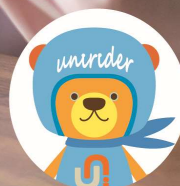
ユニライフマスコットキャラクター「ユニライター」